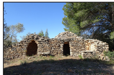
10 (X: 302186 Y: 4536958, codi W_17436) 11 (X: 302128 Y: 4536783, codi W_17437) 12 (X: 301814 Y: 4536712, codi W_19579)