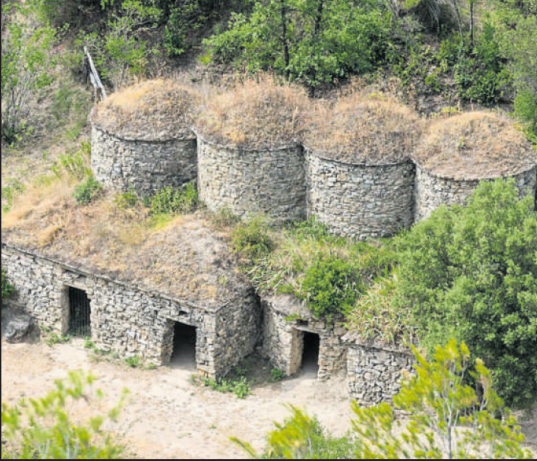
Un dels conjunts de tines al Pont de Vilomara i Rocafort

ya (27.000 hectàrees). L'art de la pedra seca va ser inclòs el 2018 a la llista del patrimoni cultural immaterial per la Unesco. L'incendi de l'estiu passat, que va afectar les valls del Flequer i el Farell, va revifar el passat vitivinícola de la zona, ja que aquestes construccions no es van veure afectades pel foc.