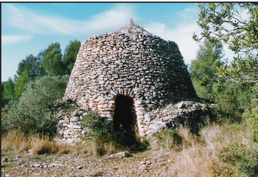
barraca 3 (X: 326117 Y: 4547338, codi W_2250)