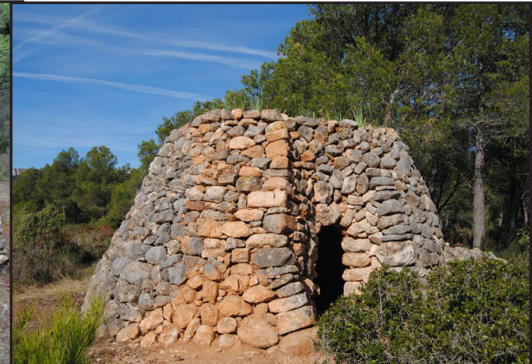
barraca 4 (X: 326015 Y: 4547404, codi W_2255)