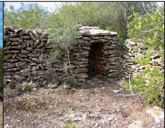
barraca 7 (X: 325239 Y: 4547902, codi W_19844)