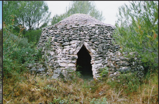
barraca 1 (X: 326309 Y: 4547217, codi W_2283)