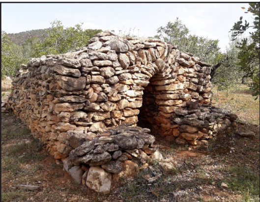
barraca 6 (X: 325672 Y: 4547912, codi W_2284)