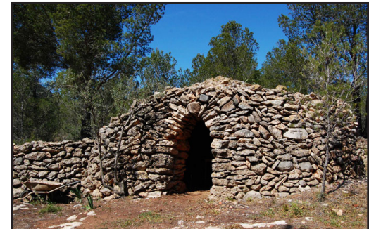
barraca 10 (X: 324941 Y: 4548119, codi W_2289)