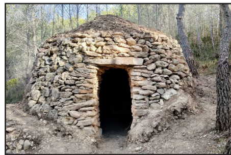
Vista de la cabana un cop restaurada

Sitges codi 001 de Wikipedra, catalogada el 1998. Amb total desconeixement per part nostre.