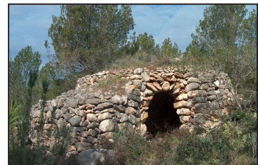
barraca 11 (X: 325031 Y: 4548235, codi W_2288)