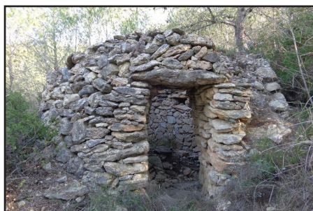
Vista de la cabana abans de restaurar