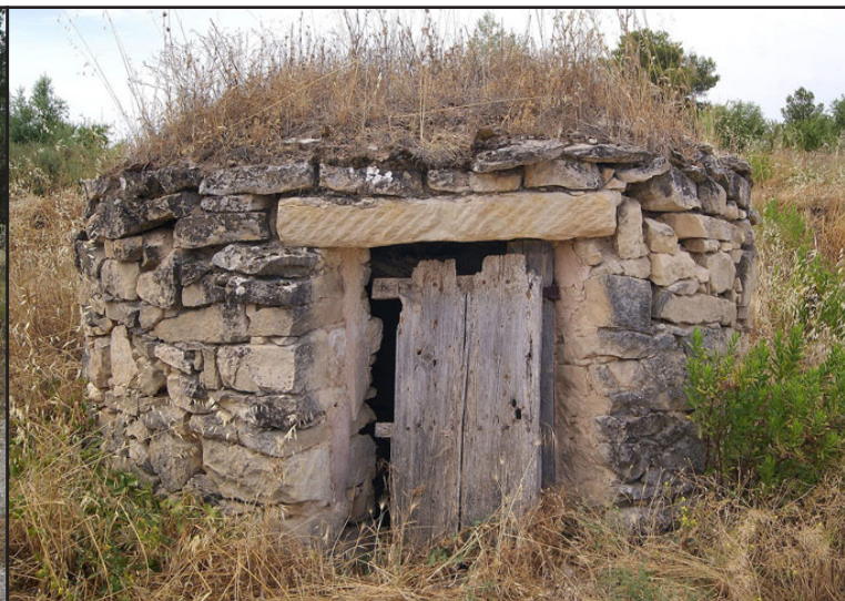
cisterna 2 (X: 329296 Y: 4596117, codi Waigua_396)