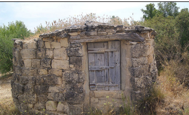
cisterna 5 (X: 329138 Y: 4596179, codi Waigua_395)