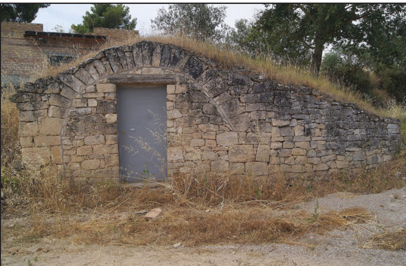
cabana 1 (X: 329316 Y: 4596146, codi W_17928)

Informa: Ramon Artigas, Drac Verd de Sitges ( dracverd.catpaisatge@hotmail.com )