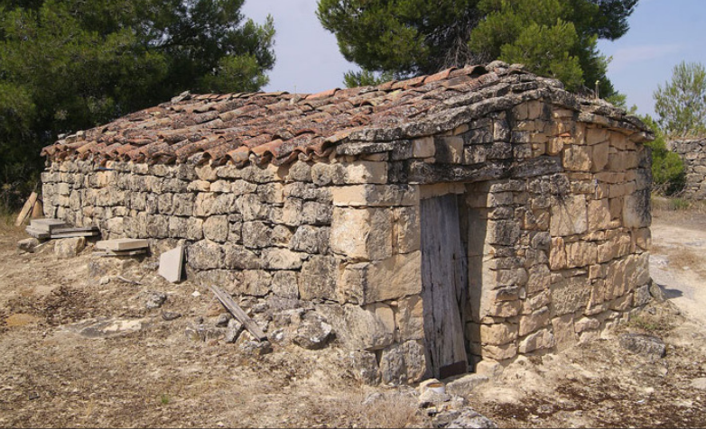
cabana 3 (X: 329154 Y: 4596122, codi W_17980)