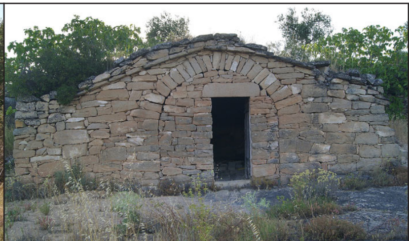
cabana 6 (X: 328795 Y: 4596193, codi W_17920)