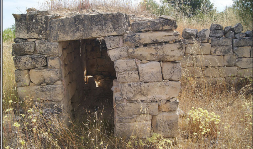
cabana 4 (X: 329100 Y: 4596134, codi W_17927)