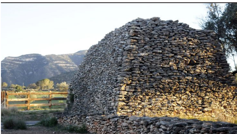
Barraca de pedra seca de les Terres de l'Ebre