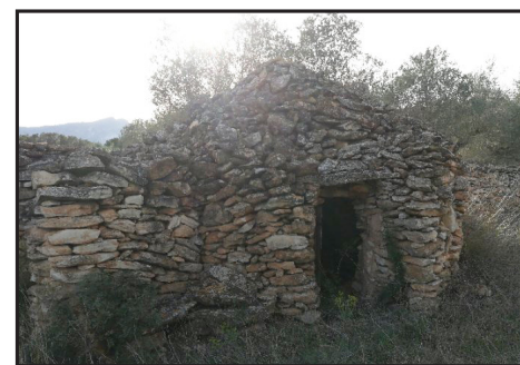
7 (X: 301686 Y: 4537006, codi W_19476) 8 (X: 301718 Y: 4537153, codi W_19477) 9 (X: 302178 Y: 4537058, codi W_17438)