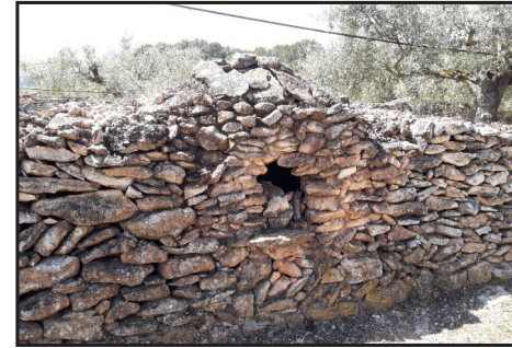
4 (X: 301680 Y: 4536746, codi W_19526) 5 (X: 301683 Y: 4536777, codi W_19527) 6 (X: 301688 Y: 4536847, codi Fornes_338)