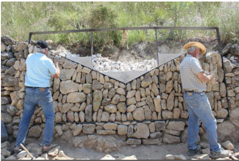
Marge del congrés

la necessitat d'obrir processos participatius i de fer pedagogia sobre el paisatge vitivinícola i la tradició al Penedès.