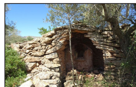
13 (X: 301749 Y: 4536695, codi W_19529)