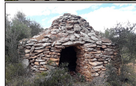
14 (X: 301730 Y: 4536697, codi W_19528)