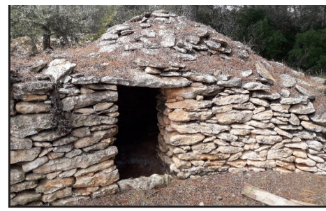
1 (X: 301556 Y: 4536750, codi W_19522) 2 (X: 301564 Y: 4536745, codis W_19523 i W_19524) 3 (X: 301612 Y: 4536728, codi W_19525)