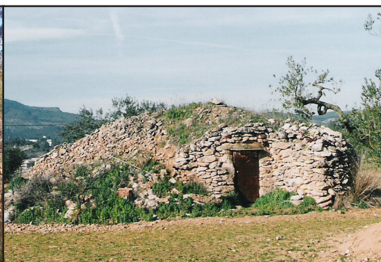
barraca 3 (X: 389272 Y: 4591325, codi W_1720)