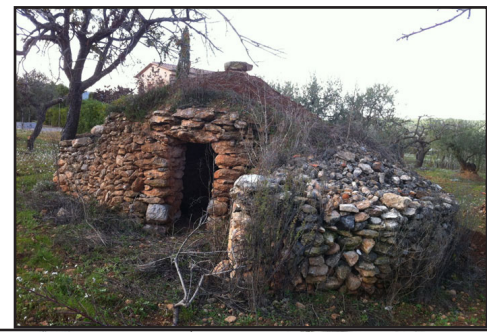
barraca 14 (X: 389297 Y: 4591494, codi W_7252)