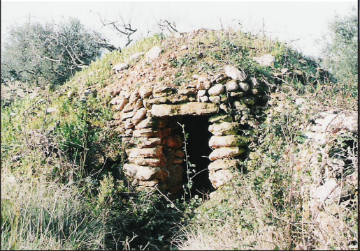
barraca 5 (X: 389539 Y: 4591050, codi W_8053) barraca 6 (X: 389522 Y: 4591099, codi W_8052),