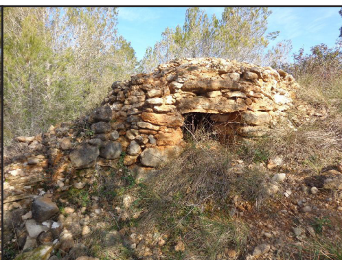
barraca 2 (X: 389134 Y: 4591493, codi W_10736)