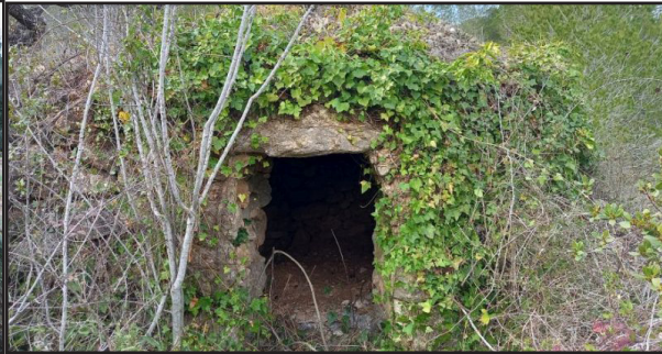
barraca 10 (X: 389493 Y: 4591304, codi W_1721) cisterna 11 (X: 389543 Y: 4591623, codi Waigua_73) barraca 12 (X: 389408 Y: 4591609, codi W_12040)