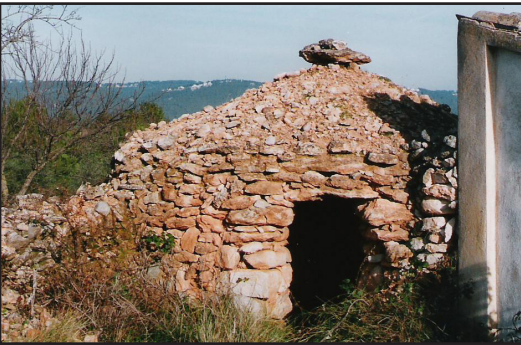
barraca 13 (X: 389389 Y: 4591546, codi W_1715)