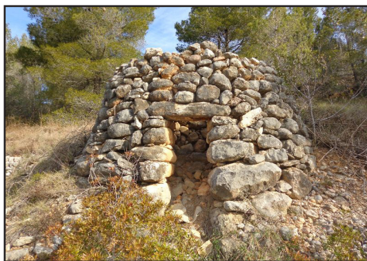
barraca 1 (X: 389059 Y: 4591505, codi W_10735)

Informa: Ramon Artigas, Drac Verd de Sitges ( dracverd.catpaisatge@hotmail.com )