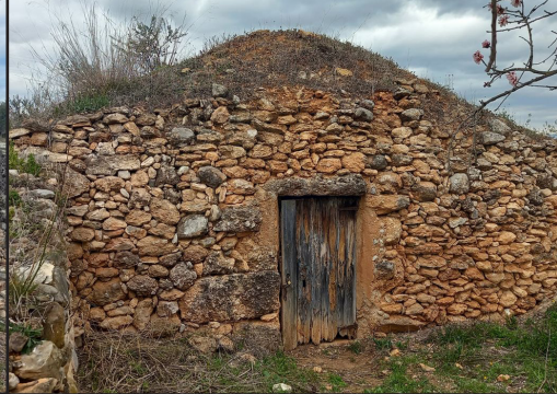
barraca 7 (X: 389472 Y: 4591155, codi W_1718) barraca 8 (X: 389520 Y: 4591190, codi W_1717) barraca 9 (X: 389425 Y: 4591262, codi W_1719)