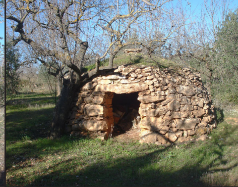
barraca 4 (X: 389423 Y: 4591087, codi W_1716),