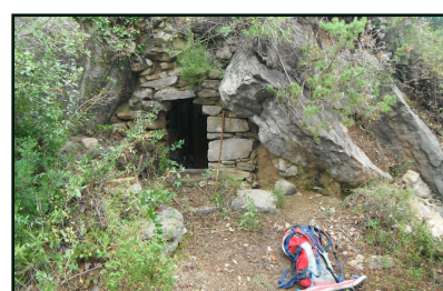
Barraca d'en Lluci