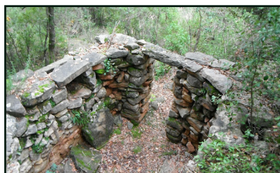
Cabana Gran de la Solella de l'Oller