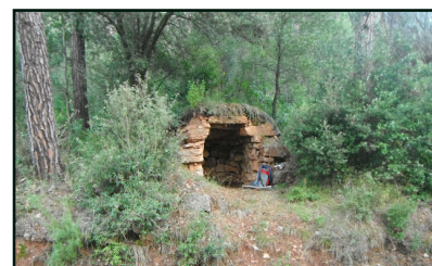
Cabana del torrent de la Baga