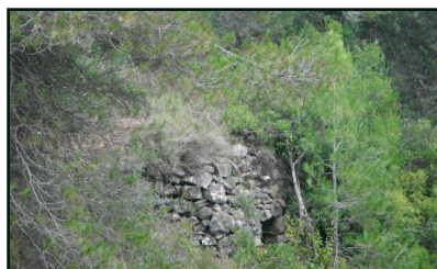
Cabana de la Solella de l'Oller