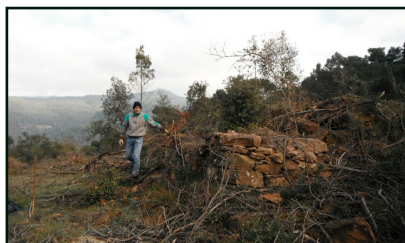
Cabana del Bac davant l'Església