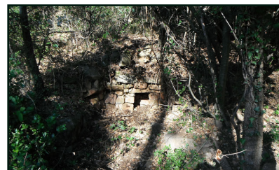
Barraca de les Mirones, amb la fornícula