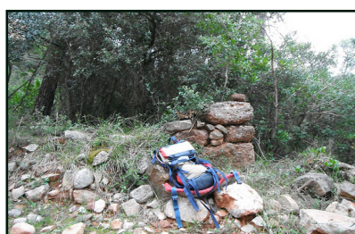
Cabana del coll de Pedra Dreta