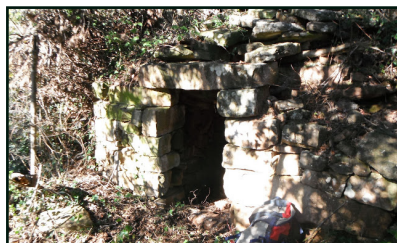
Barraques de les Mirones