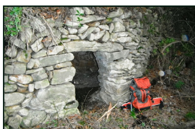
Cabana de la Trona